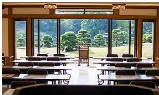
清澄庭園 大正記念館